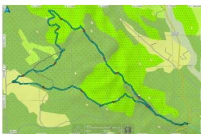
CRETE DE L AIGLE